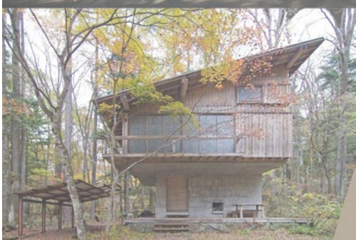
吉村順三 軽井沢の山荘