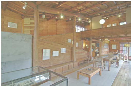
A・レーモンド 夏の家