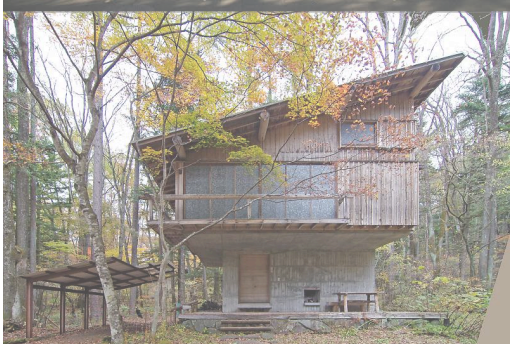
吉村順三 軽井沢の山荘