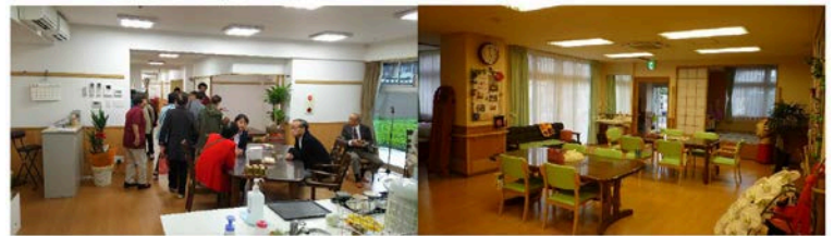
リアン放生津(中町H25.5) イヤサー新湊