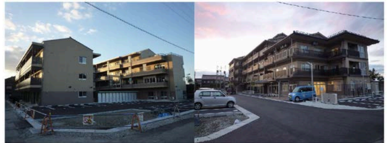
ラ・メール放生津(奈呉町H28.4) いつでも来られま放生津