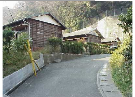
大津住宅