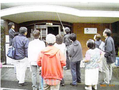
専門家と住民のマンション調査風景