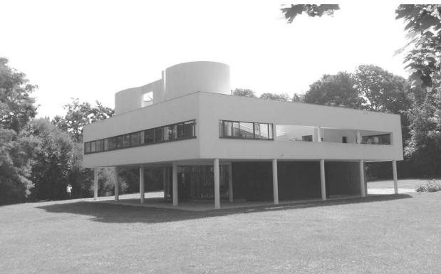
北西側外観 屋上に日光浴の場の風除壁