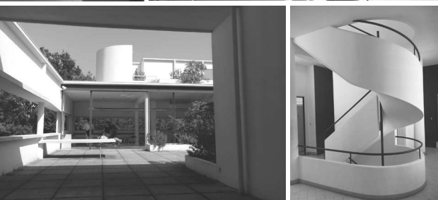
上左 斜路、左側に階段 上右 広間からテラスを見る 下左 有蓋テラスから広間方向を見る 下右 階段